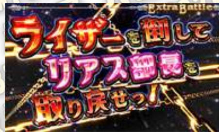
エクストラバトル (EXTRA BATTLE)