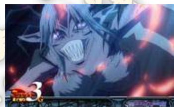
ミッテルト (米忒托)