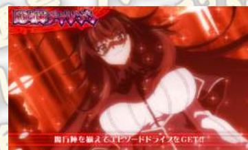
魔法陣チャレンジ