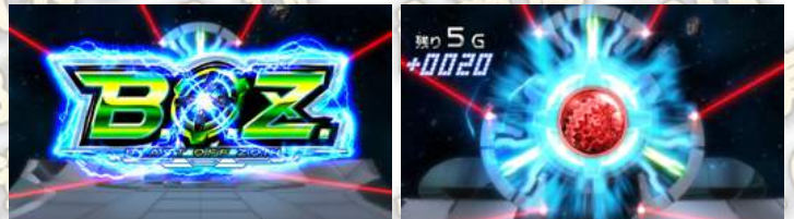
BLAST OFF ZONE