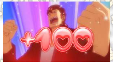
パトランチャンス