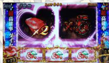
フルスロットモード