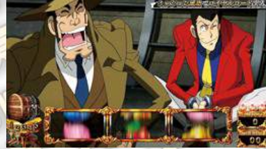
即使跑到天上也要抓到你! 魯邦!你的好運到此為止