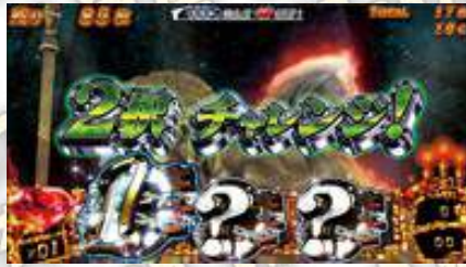
DEAD or ALIVE