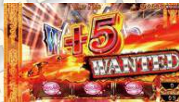
LUPIN THE WANTED