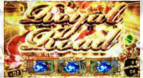
ROYAL ROAD 康莊大道