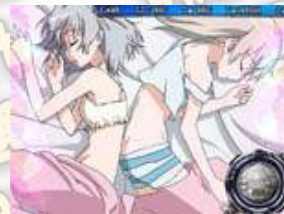
< エイラ(艾拉) 的房間(濃厚)