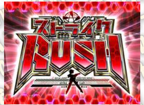
STRIKE 強襲 RUSH