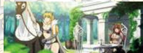
トモエ(武者巫女巴) 宿舍