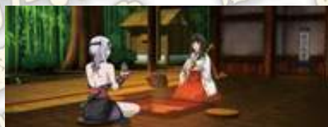
エリナ(近衛隊長艾莉娜) 宿舍]