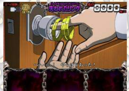
失われたリング(失去的手環) (獲得リング(手環)數：3) 在垃圾房間中，發現手環為完成任務，是アトラクション(關卡)中期待度最高的！