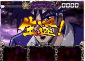
クォータージャンプ(四面跳躍)(獲得リング(手環)數：3) 如果看出對岸的一個方向，生還為 ART 突入。