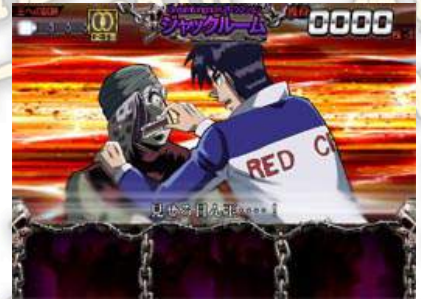
ジャックルーム(捷克的房間) (獲得リング(手環)數：2) 如果看出切斷的捷克手指的把戲的話，ART 突入。