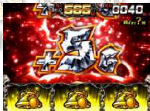
霸王ルーレット(輪盤)