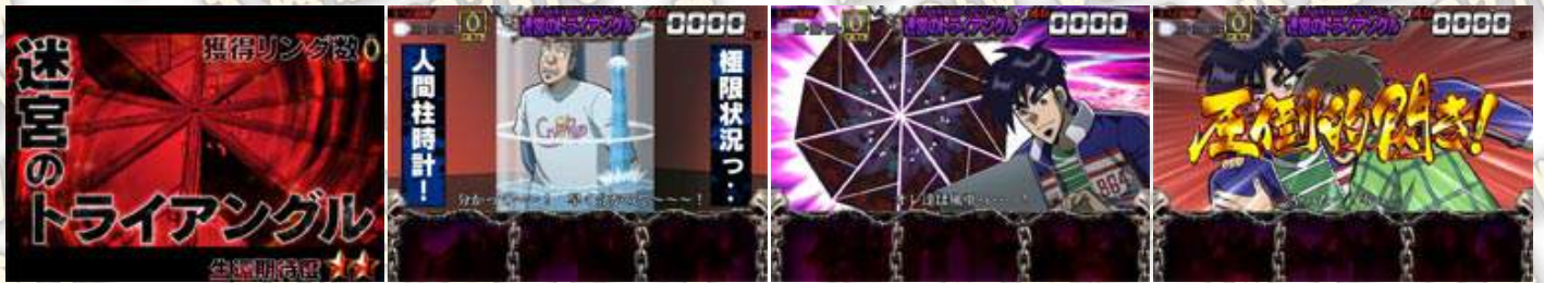
迷宮のトライアングル(迷宮的三角) (獲得リング(手環)數：1) 在人質被放入的水槽裝滿水之前，解決問題為 ART 突入。