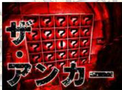
ザ・アンカー舞台